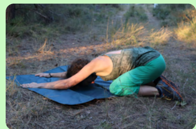
Position de l'enfant

Même position, dos creux en serrant les fesses